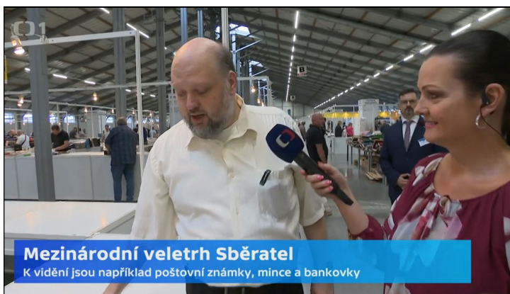
Mezinárodní veletrh Sběratel K vidění jsou například poštovní známky, mince a bankovky