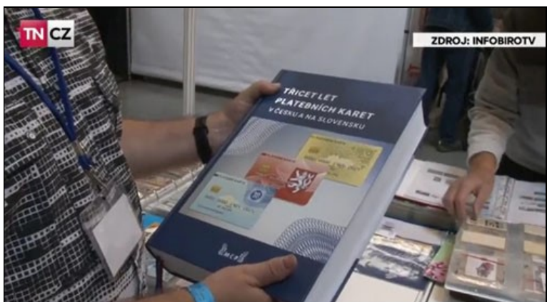
V den zahájení veletrhu vysílala Česká televize živě z výstaviště Dobré ráno Studia 6, kde byla představena i kniha.