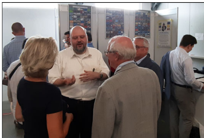
Autor při diskuzi s odbornou veřejností o knize