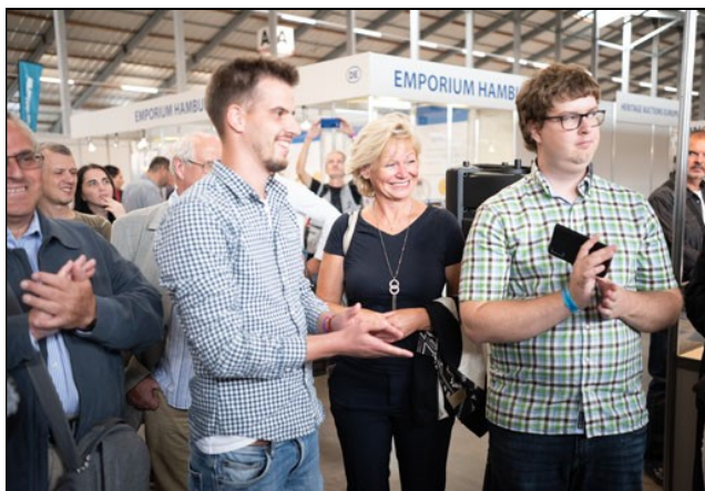
Vzácní pozvaní hosté a veřejnost při křtu knihy